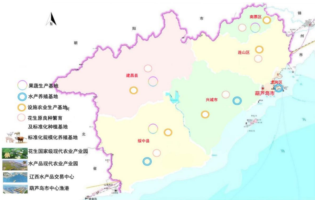
图 6-1 农业产业发展布局图